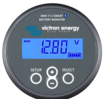
Detección de Bluetooth BMV-712 Smart Battery Monitor