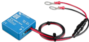
Detección de Bluetooth Smart Battery Sense