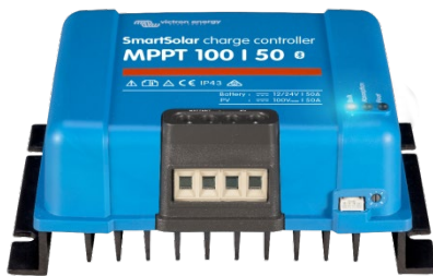
Controlador de carga SmartSolar MPPT 100/50